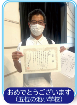
おめでとうございます(五位の池小学校)