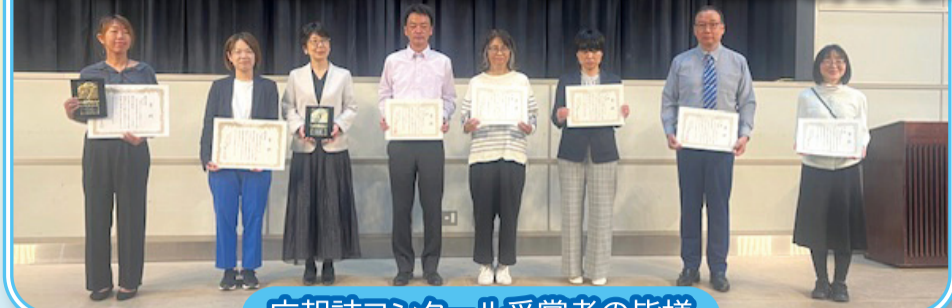
広報誌コンクール受賞者の皆様

広報紙を作成しないPTAも増えているなかで、「PTA活動」を伝える意味で必要と考えるPTAがあるのも事実です。温かな親目線を感じられる作品ばかりでした。