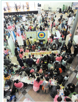
こっぺっ子対象事業の一つ 神戸市PTA協議会の「神戸市PTAフェスティバル」(写真は2018年のもの)

「こっぺっ子対象事業」実施の主な団体(2022) 神戸市立中学校PTA連合会 神戸市兵庫区小学校PTA連合会 こども編集部 わくわくプロジェクト しおやタイムカプセル こどもt.oおむすび お味噌の会 神戸市PTA協議会