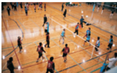
だき、とても有意義な行事となりました。

多数の方より、学生に戻ったようで楽しかった、チームの皆さんと知り合えて良かった、来年もぜひ参加したいという意見をいただきました。