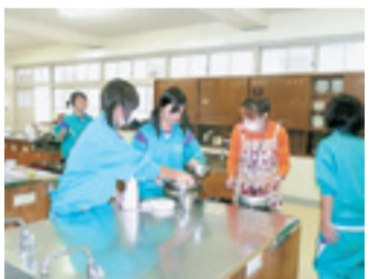
のすばらしさの感動とともに、育友会・かしの会・地域の方々の連携に感謝のトライやるウィークでした。

そこで、トライやる推進委員会で意見を求めたところ、育友会・かしの会(育友会 O B )・地域の方々協力して生徒に教えるとい