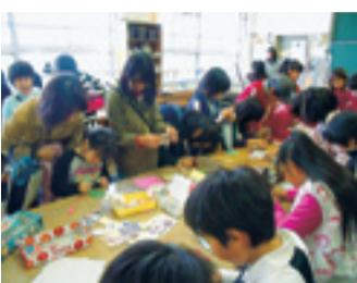
今年インフルエンザの影響で、縮小開催となりましたが、地域とのつながりを深めることも有意義なフェスティバルでした。

内容としては、学年ごとの P T A 役員が企画したゲーム。低学年も高学年もみんなが楽しめるよう、いろいろ工夫がされています。